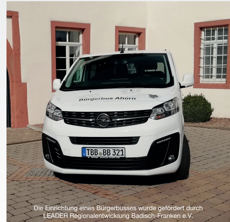
Die Einrichtung eines Bürgerbusses wurde gefördert durch LEADER Regionalentwicklung Badisch-Franken e.V.